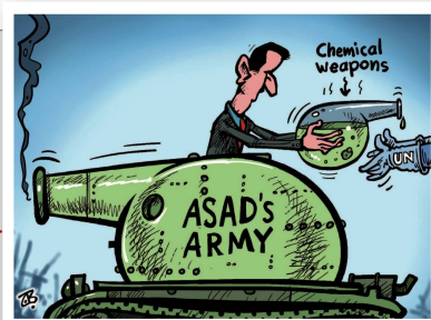
Jordanien Assads chemische Waffen