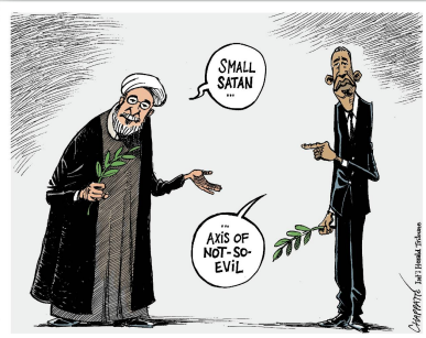
Patrick Chappatte Int.: Herald Tribune Der kleine Satan und die Achse des Nicht-so-Bösen