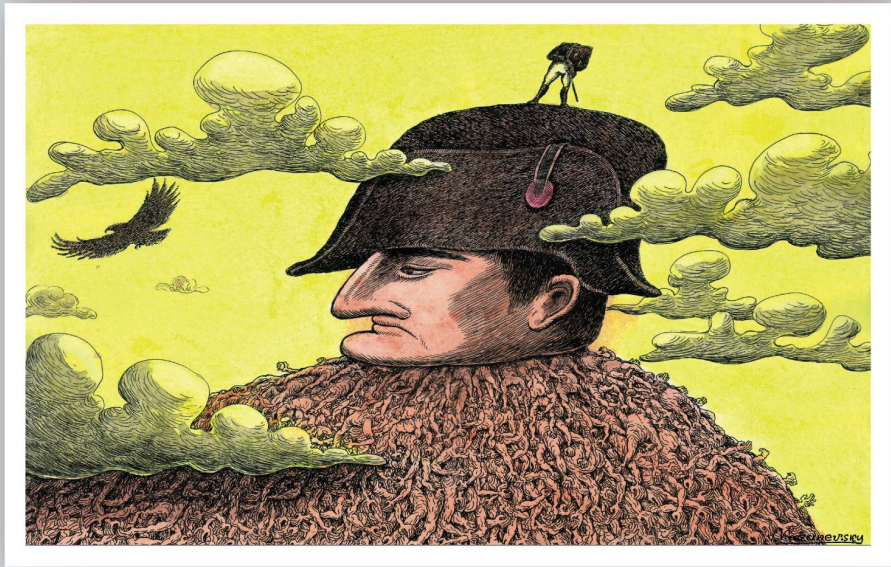
CARTOONS: VLADIMIR KAZANEVSKY