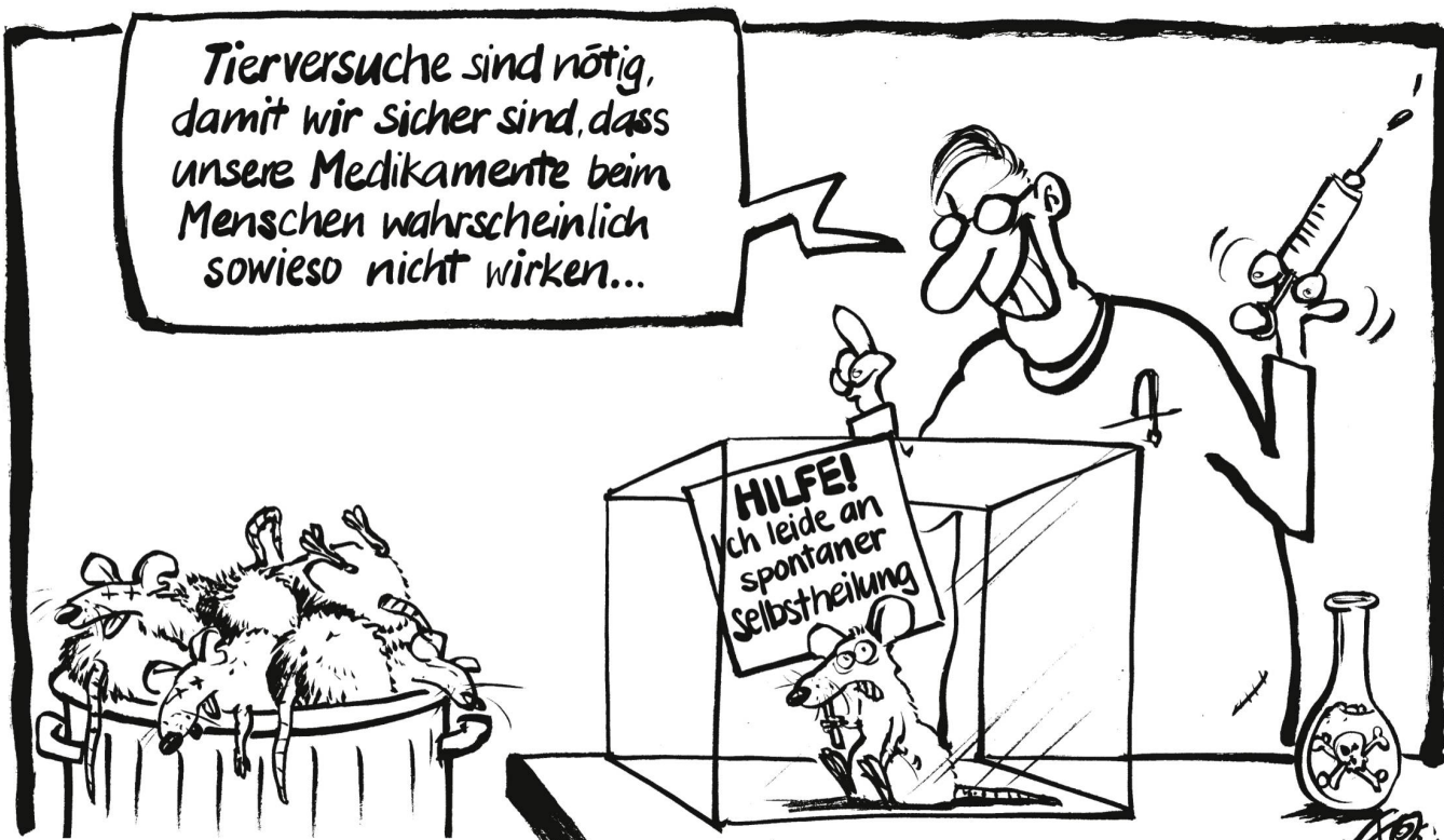
Obwohl Tierversuche für die Humanmedizin kaum repräsentative Resultate bringen, wurden in der Schweiz letztes Jahr rund 600 000 Tiere für Versuche eingesetzt.