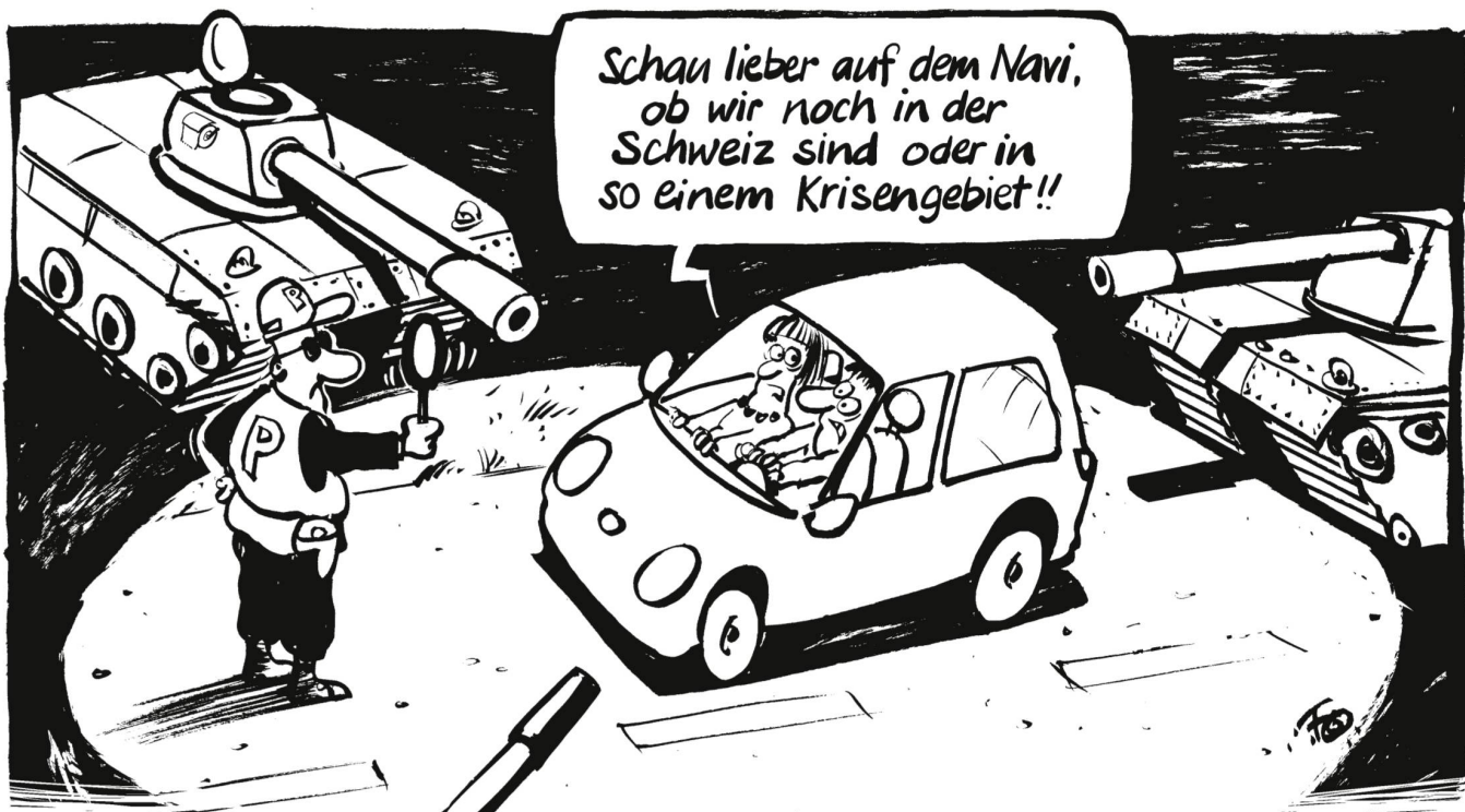
In einer bisher einmaligen Schwerpunktaktion macht die Baselbieter Polizei zusammen mit der Militärpolizei Verkehrskontrollen und Patrouillen. Linke Politiker wehren sich dagegen, dass Armeeinghörige Polizeiaufgaben übernehmen.