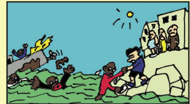
Die Boatpeople Die Italiener