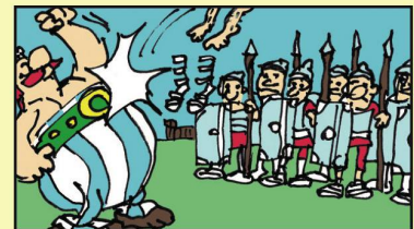
Obelix Die Römer