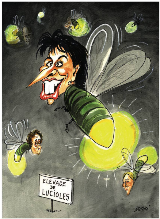
Der Bundesrat und die grosse Wende: Doris Leuthard und Co. auf dem Weg in die erneuerbare Energiezukunft.