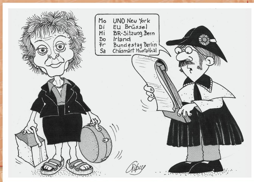
Voller Terminkalender: Das Präsidialjahr ist für Bundesräte jeweils eine echte Belastungsprobe.

Gibsy (Gilbert Kammermann) | Bote der Urschweiz