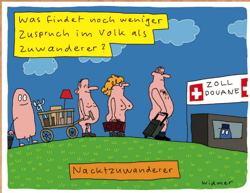
Emotionale Themen 2012: Wenn Nacktwandern und Zuwandern am Stammtisch die Gemüter erhitzen.