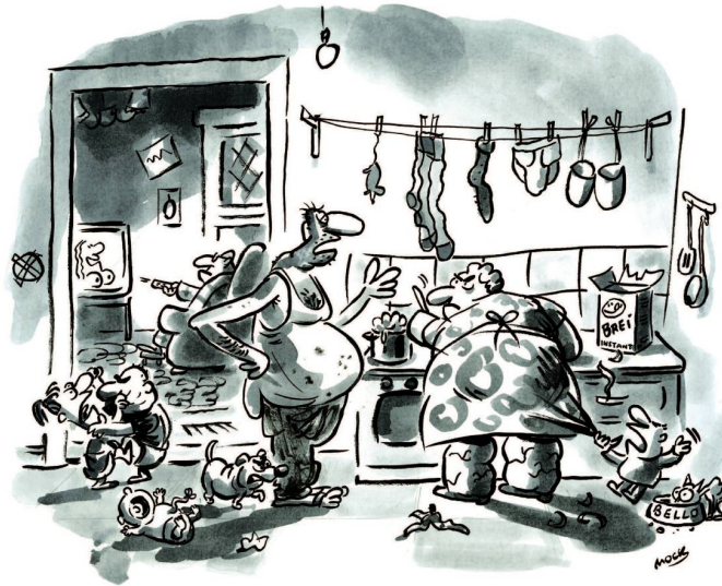
„Komm, lass uns noch mal ganz von vorne anfangen!“