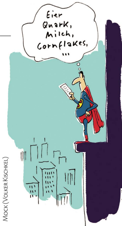
MOCK (VOLKER KISCHKEL)

Die Ära der Helden ist passee. Wir leben im Zeitalter der Tycoons.