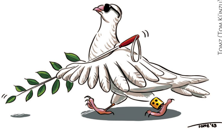
TOMZ (TOM KÜNZLU)