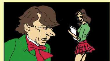
Polanski Die Minderjährige