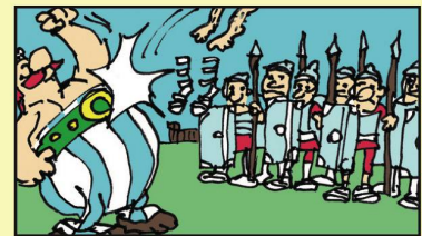
Obelix Die Römer