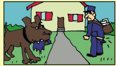
Der Hund Der Briefträger