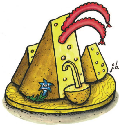
Bündner Bergkäse mit Steinbock-Wurstchen und Kartoffelstock.