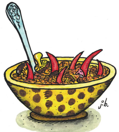
Ungarisches Pilz-Gulasch mit pikanten Chili-Zwergen.