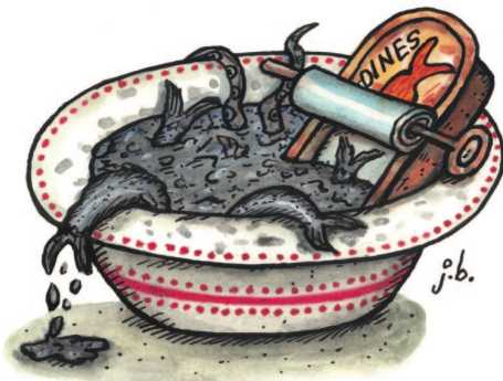
Mediterrane Bouillabaisse catastrophe mit Ölsardinen aus rostiger Dose.