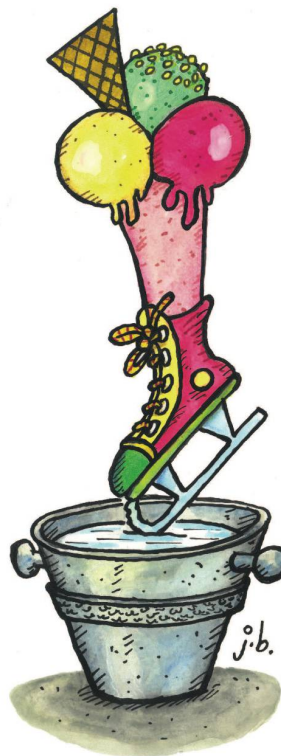
Deutsches Eisbein auf gefrorenem Nordsee-Wasser.