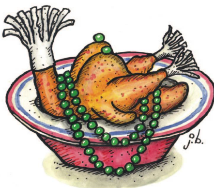
Gefüllte Perlhuhnbrust (kein Silikon) mit schottischer Erbsenkette.