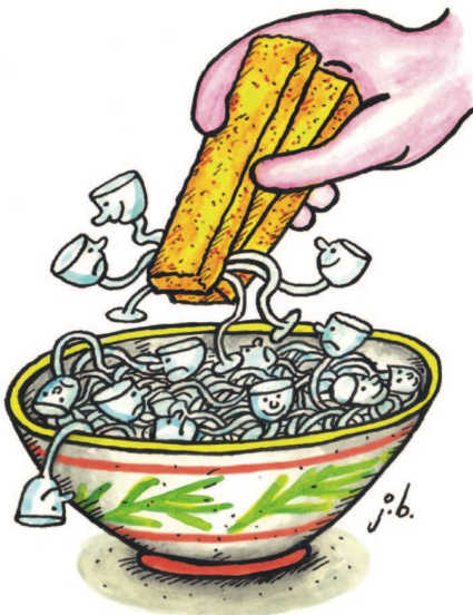
Chinesische Fischstäbchen mit süßsauren Glasnudeln.