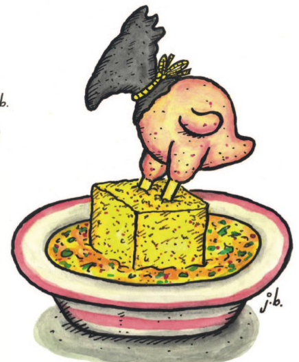
Sizilianisches Suppenhuhn im knusprigen Polenta-Sockel.