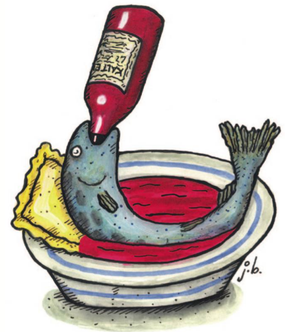
Forelle blau im südtiroler Kalterersee auf Ravioli-Kissen.