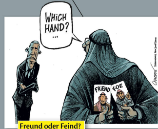
Freund oder Feind?