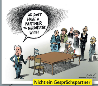
Nicht ein Gesprächspartner