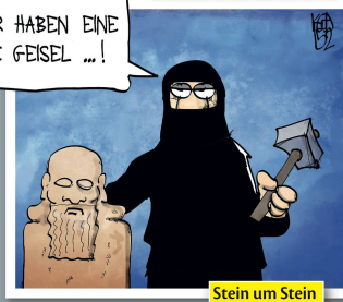
Stein um Stein

Endlich mal eine gute Nachricht: Der Nachrichtendienst des Bundes arbeitet neu rund um die Uhr! Zu erreichen ist er trotzdem nicht.