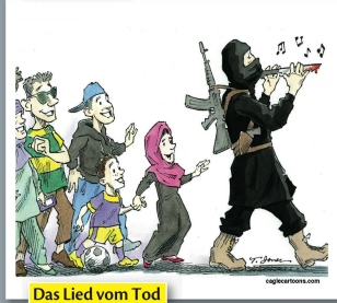
Das Lied vom Tod