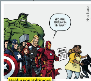
Heldin von Baltimore