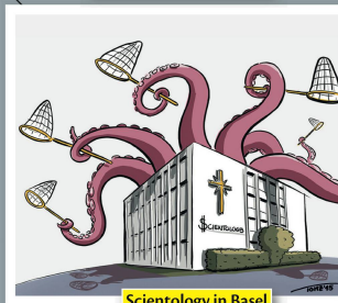
Scientology in Basel