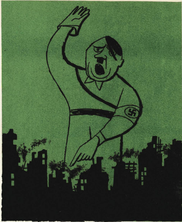
Hitler sagte vor 10 Jahren in einer Rede:

„In 10 Jahren werdet Ihr Eure Heimstätten und Städte nicht mehr erkennen!“