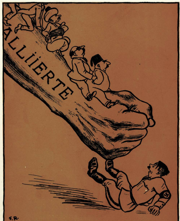
Die neuesten Kriegserklärungen „Wir kämpfen mit!“

(zu den Absprüngen in der deutschen Kolonie)