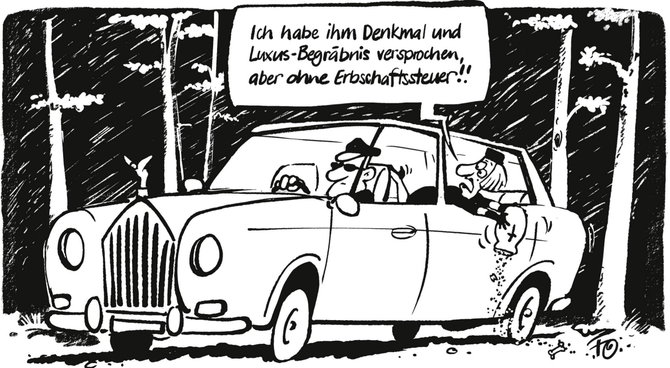
Heute besitzen die reichsten zwei Prozent etwa so viel wie die restlichen 98 Prozent der Bevölkerung. Mit der Erbschaftssteuer soll sich das ändern.