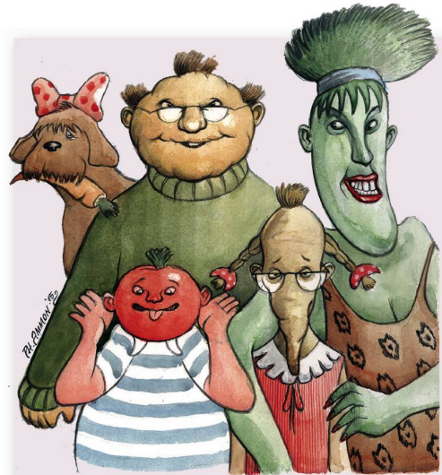
- EINE SCHRECKLICH VEGANE FAMILIE.