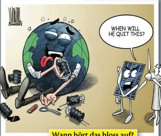
Wann hört das bloss auf?