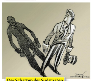
Der Schatten der Südstaaten