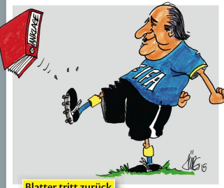
Blatter tritt zurück