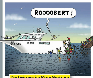
Die Geissens im Mare Nostrum