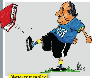
Blatter tritt zurück