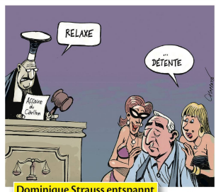
Dominique Strauss entspannt