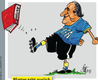
Blatter tritt zurück