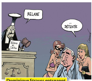
Dominique Strauss entspannt