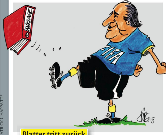
Blatter tritt zurück