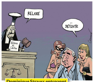
Dominique Strauss entspannt