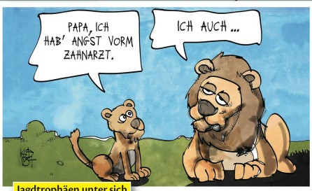
Jagdtrophäen unter sich