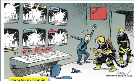
Disaster in Tianjin