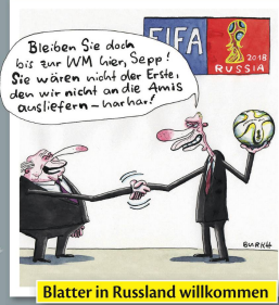
Blatter in Russland willkommen