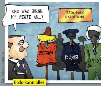
Erdo kann alles