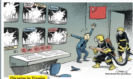
Disaster in Tianjin