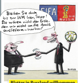
Blatter in Russland willkommen