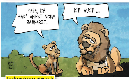
Jagdtrophäen unter sich