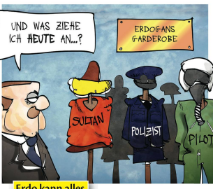
Erdo kann alles