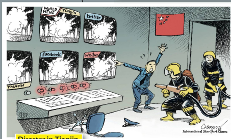
Disaster in Tianjin