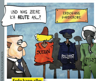
Erdo kann alles