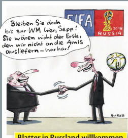
Blatter in Russland willkommen