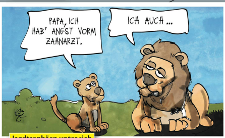
Jagdtrophäen unter sich