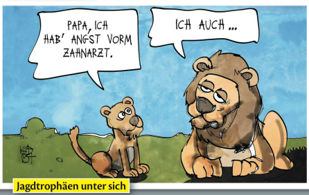
Jagdtrophäen unter sich