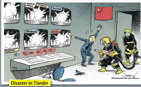
Disaster in Tianjin