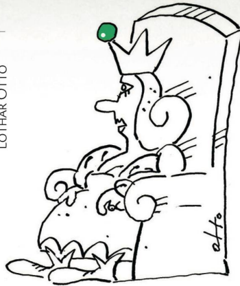
auf der Prinzessin

Wahrheit nicht nur eine griesgrämige Wolkschieberin, sondern eine abgefeimte Rassistin. Um es ohne grosse Gewissensbisse mit einem grossen Kessel voll Pech überschütten und damit als Schwarze abwerten und moralisch deklassieren zu können, war ihr daran gelegen, ein von vornherein als