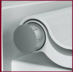
Controller mit Dreh- und Drückfunktion