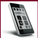
Fernbedienung mit Touchscreen