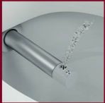
Power-Dusche für zusätzlichen Druck