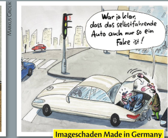
Imageschaden Made in Germany