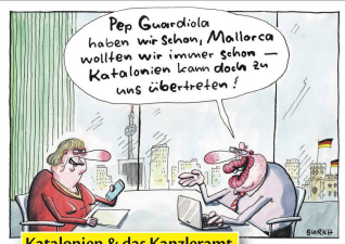
Katalonien & das Kanzleramt