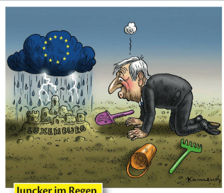
Juncker im Regen