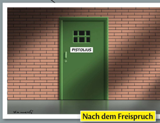
Nach dem Freispruch