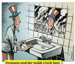
Ferguson und der müde Uncle Sam