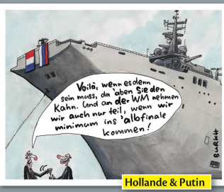
Hollande & Putin