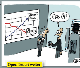
Opec fördert weiter