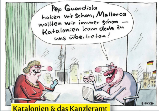
Katalonien & das Kanzleramt