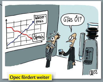
Opec fördert weiter