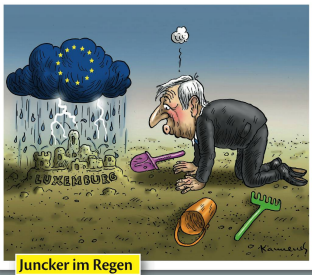
Juncker im Regen