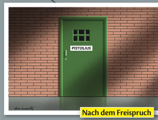
Nach dem Freispruch