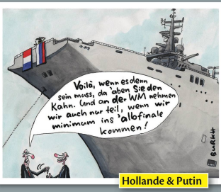
Hollande & Putin