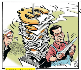
Gyros « Tsipras »