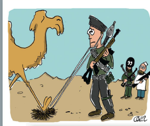
Abtraum eines bartlosen Jihadisten