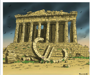
Euro in Athen bald Geschichte?