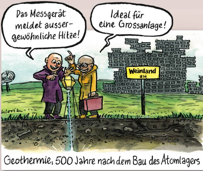
Geothermie, 500 Jahre nach dem Bau des Atomlagers