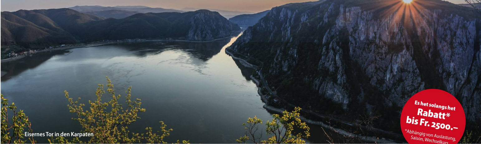
Eisernes Tor in den Karpaten

Es het solangs het Rabatt* bis Fr. 2500.- *Abhängig von Auslastung, Saison, Wechselkurs