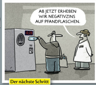
Der nächste Schritt