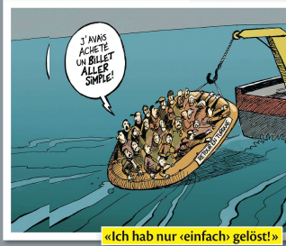
«Ich hab nur «einfach» gelöst!»