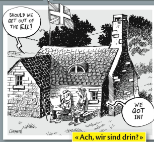
«Ach, wir sind drin?»