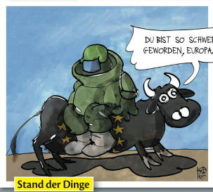
Stand der Dinge