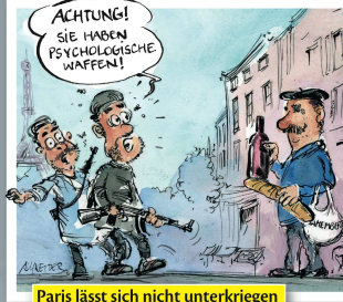
Paris lässt sich nicht unterkriegen