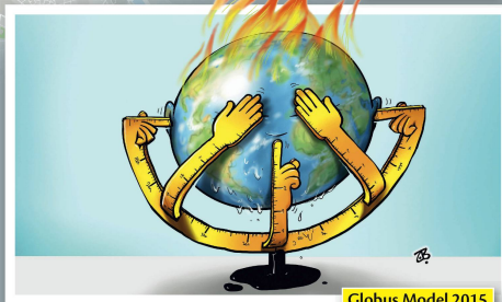
Globus Model 2015