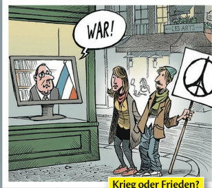
Krieg oder Frieden?