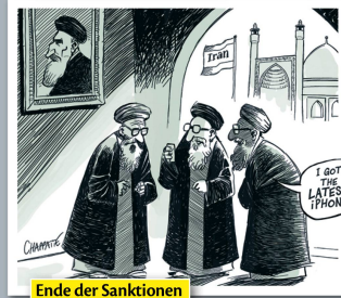
Ende der Sanktionen