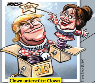
Clown unterstützt Clown