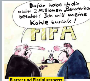
Blatter und Platini gesperrt