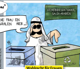
Wahlrecht für Frauen