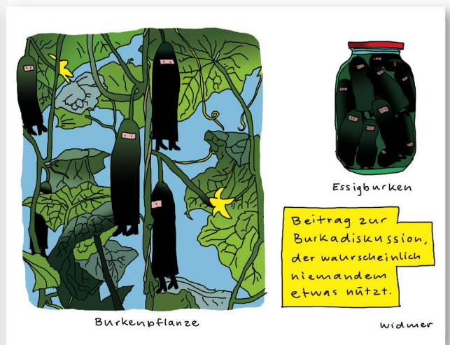
Platz 3: Ruedi Widmers krampflosender Beitrag zum Burkaverbot.