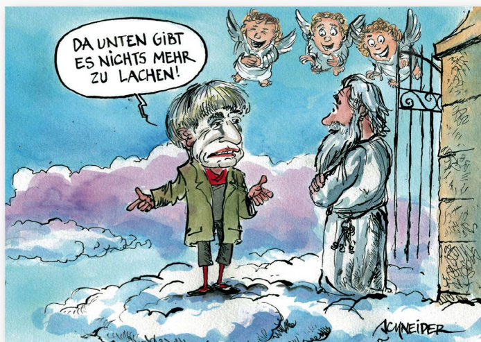
Platz 2: Carlo Schneiders Nachruf auf Dimitri trifft den Nerv der Zeit.

Die 10. Ausgabe von «Gezeichnet» wird im Dezember 2017 wieder im Berner Museum für Kommunikation stattfinden. (red.)