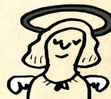
Mach mal Pause!