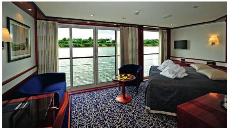
Deluxe Suite (22 m 2 ) mit franz. Balkon