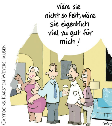
CARTOONS: KARSTEN WEYERSHAUSEN