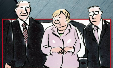
Merkel zum Vierten

Die endgültige Geschichte des Kantons Thurgau