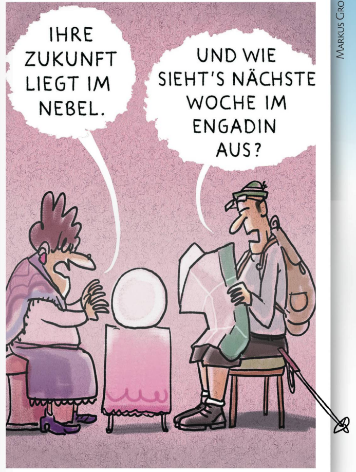
NICHTSCHWIMMERIN IM NEBELMEER