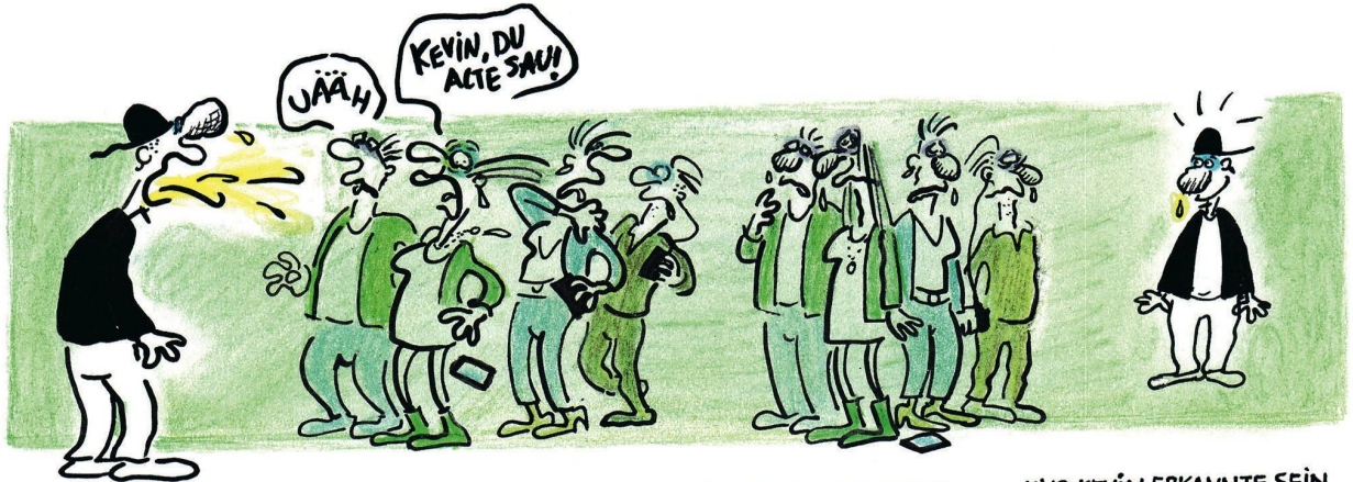
FREUNDE BEKAM ER SO NICHT...