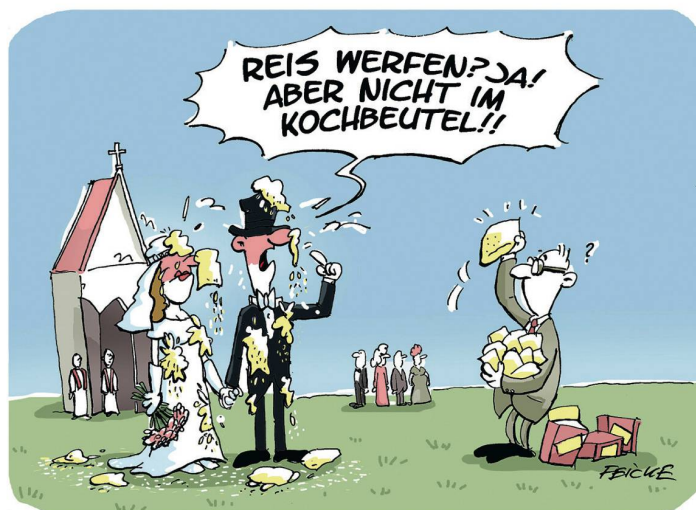
CARTOONS: TIM OLIVER FEICKE