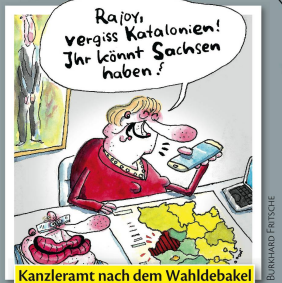
Kanzleramt nach dem Wahldebakel