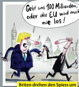
Briten drehen den Spieß um