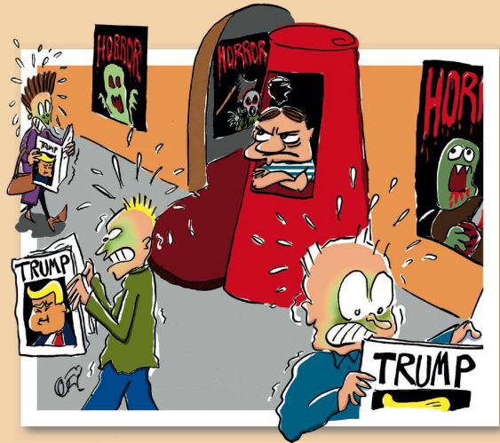
OGER (ANDREAS ACKERMANN)