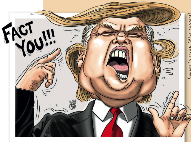
SWEN (SYLVAN WEGMANN)