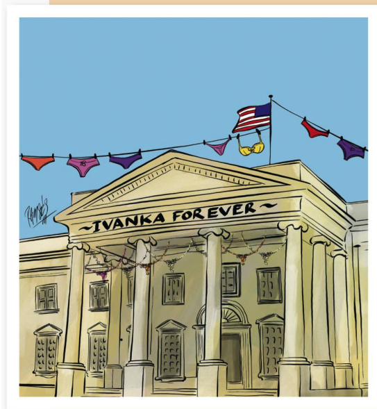
RAMSES MORALES IZQUIERDO