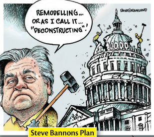
Steve Bannons Plan