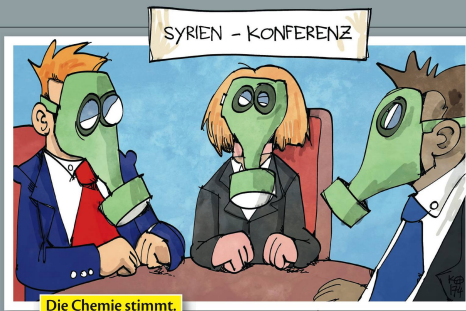
Die Chemie stimmt.