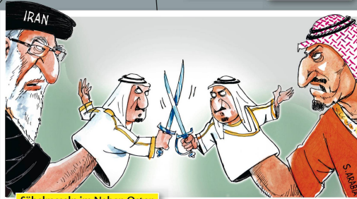
Säbelrasseln im Nahen Osten