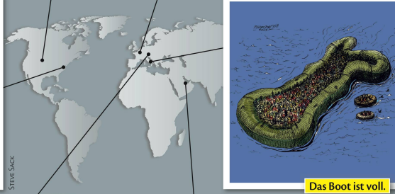
Das Boot ist voll.